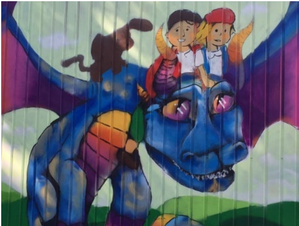
Graffitis erstellt im Kunst-Projektunterricht unterschiedlicher Jahrgänge der Erich Kästner Oberschule (2019)